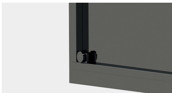
Dos d'un Tabloid avec supports muraux et aimants